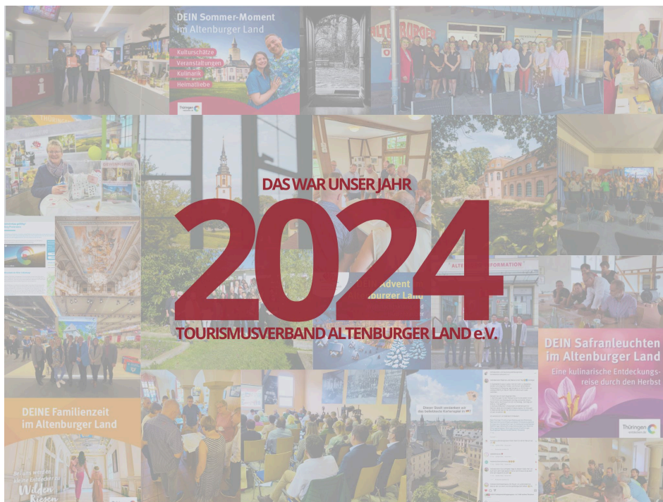
Foto: Jahresrückblick 2024

Vielen Dank, dass Sie uns durch 2024 begleitet haben! Nun freuen wir uns darauf, gemeinsam mit Ihnen ein erfolgreiches und aufregendes 2025 zu gestalten. Auf ein großartiges neues Jahr!