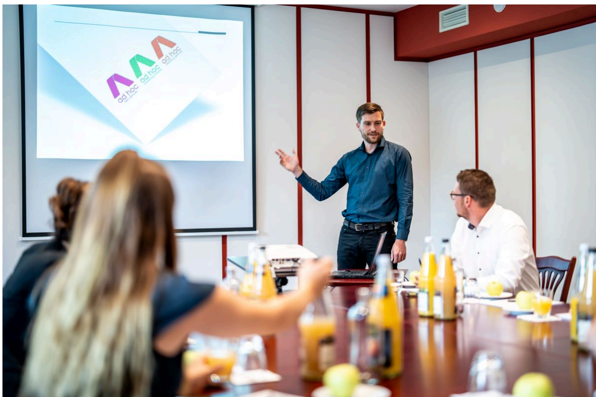
Tagen im Hotel Reussischer Hof in Schmölln

Senden Sie Ihr ausgefülltes Formular an unsere Kollegin Saskia Landgraf an saskia.landgraf@altenburg.travel .