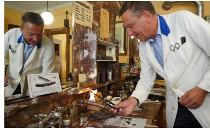
Frisieren wie im letzten Jahrhundert im Historischen Friseursalon