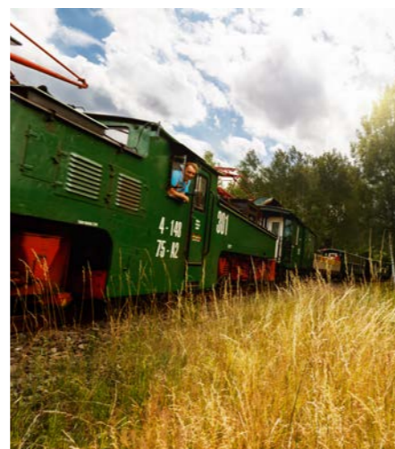
Fahrt mit der Kohlebahn durch den Kammerforst