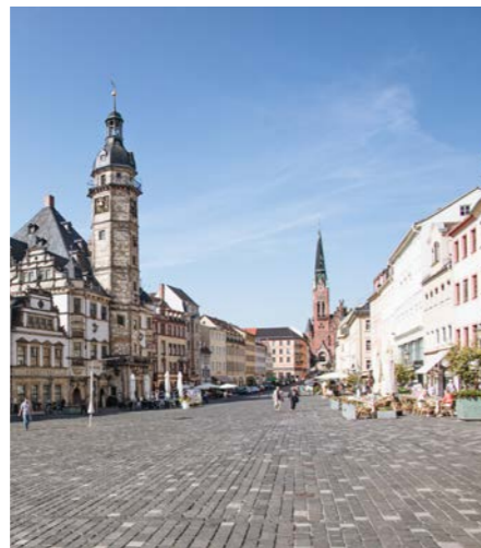
Blick auf den Altenburger Hauptmarkt mit Rathaus und Bräuerkirche