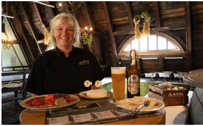
Brotzeit in der Altenburger Brauerei