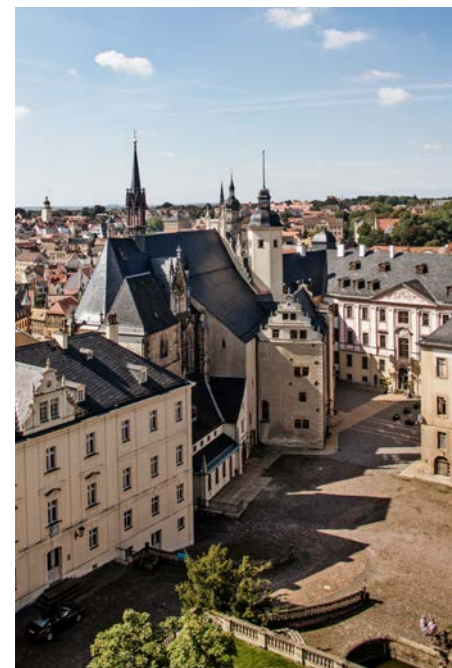
Blick auf das Residenzschloss und die Skatstadt Altenburg