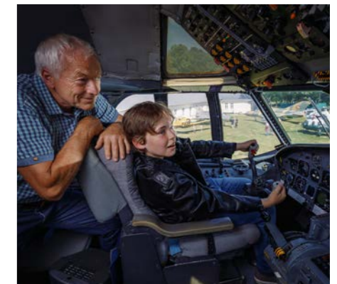
Flugwelt Altenburg-Nobitz – Museum zum Anfassen