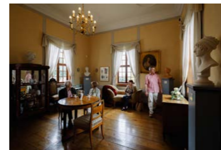
Salonkultur im Museum Burg Posterstein